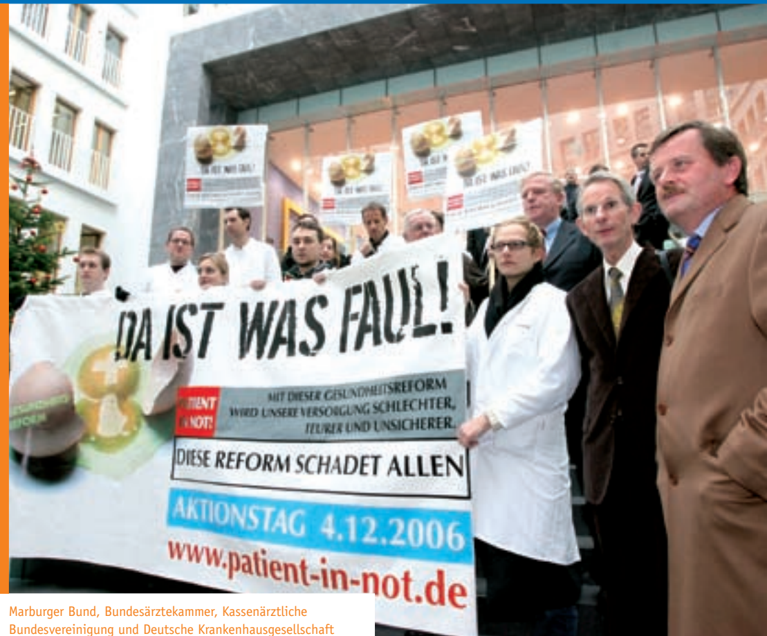
Marburger Bund, Bundesärztekammer, Kassenärztliche Bundesvereinigung und Deutsche Krankenhausgesellschaft protestieren gegen die Gesundheitsreform.