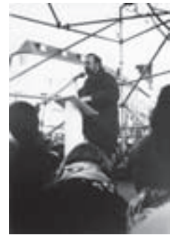
Marburger-Bund-Vize Rudolf Henke spricht auf einer Medizinstudenten-Demo in Bonn gegen die Gesundheitsreform.

Während dieser Frist bis September 1993 entschließen sich 10.500 Ärzte zur Niederlassung als Kassenarzt. Folge: In den Kliniken kommt es aufgrund des massenhaften Exodus erfahrener Krankenhausärzte zu Personalengpässen.