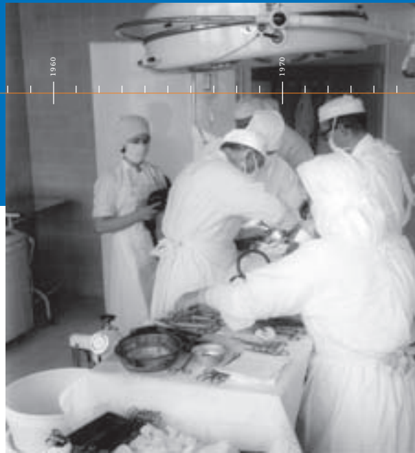
Operationssaal in den 50er Jahren.