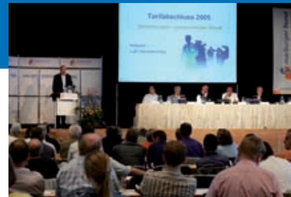
Die 108. Marburger-Bund-Hauptversammlung lehnt den TVöD ab, entzieht Verdi die Verhandlungsvollmacht und fordert die Arbeitgeber zu arzt-spezifischen Tarifverhandlungen auf.

Am zweiten bundesweiten Streik- und Protesttag des Marburger Bundes am 6. September in Stuttgart gehen 5.000 Klinikärzte auf die Straße und demonstrieren gegen Lohnraub durch längere Arbeitszeiten und Kürzungen des Weihnachts- und Urlaubsgeldes.