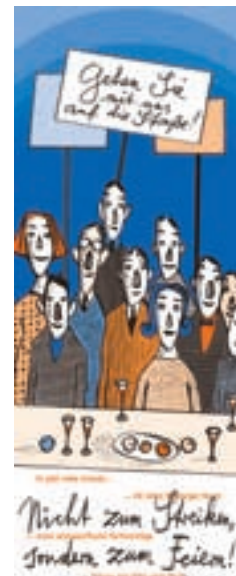
Mit einem Straßenfest wird das 60-jährige Jubiläum des Marburger Bundes gefeiert.

Sechs Jahrzehnte Verbands- und Gewerkschaftsgeschichte haben sowohl im gesundheitspolitischen als auch im tarif- und berufspolitischen Umfeld für entscheidende Veränderungen zu Gunsten der angestellten und beamteten Ärzte in Deutschland geführt.