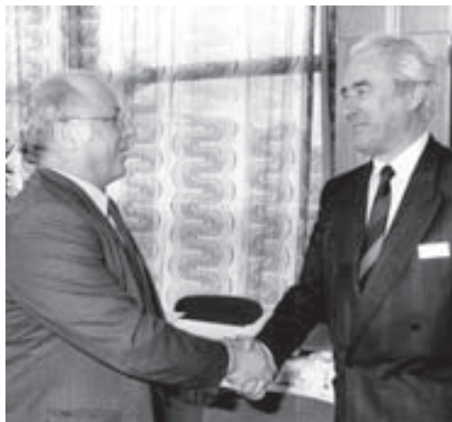
Norbert Blüm und Kasten Vilmar bei der 21. Sitzung der Konzierten Aktion im Gesundheitswesen in Bonn.

Unter dem Beifall von 5.000 demonstrierenden Medizinstudenten in Bonn verlangt der Marburger Bund eine verstärkte Aufsicht über das Geschäftsgebaren des Institutes für medizinische und pharmazeutische Prüfungsfragen (IMPP) . Hintergrund ist die Verschärfung der ärztlichen Vorprüfung.