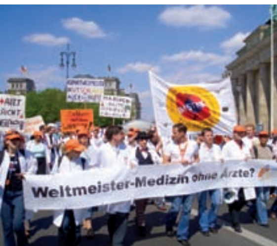
4.000 Universitätsärzte aus ganz Deutschland demonstrieren beim bundesweiten Protesttag am 3. Mai 2006 in Berlin für einen eigenen Tarifvertrag.

Marburger Bund und VKA unternehmen einen weiteren Einigungsversuch . Begleitet wird die Verhandlungsrunde am 14. August von den bisher massivsten Ärztestreiks in kommunalen Kliniken. Insgesamt legen bundesweit 17.300 Mediziner in 185 Krankenhäusern ihre