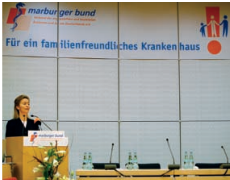
Als Schirmherrin gibt Bundesfamilienministerin Ursula von der Leyen den Startschuss zur Marburger-Bund-Kampagne „Für ein familienfreundliches Krankenhaus!“.

Ein familienfreundliches Krankenhaus ist ein Gewinn für alle – sowohl für den Arbeitgeber als auch das Klinikpersonal und die Patienten.