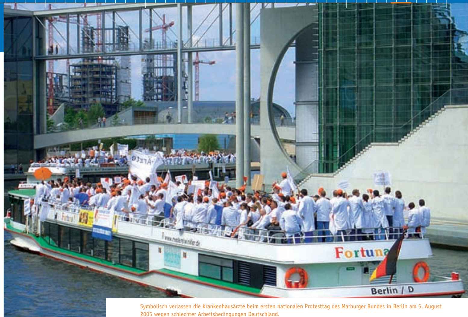
Symbolisch verlassen die Krankenhausärzte beim ersten nationalen Protesttag des Marburger Bundes in Berlin am 5. August 2005 wegen schlechter Arbeitsbedingungen Deutschland.

Ärzte der Universitätskliniken Gießen, Marburg, Heidelberg, Würzburg, Hamburg, Hannover, Mannheim, Berlin, Köln und Aachen folgen einem Aufruf des Marburger Bundes und demonstrieren gegen die von bestimmten Bundesländern vollzogene Erhöhung der Wochenarbeitszeit ohne Lohnausgleich und die Kürzungen beim Weihnachts- und Urlaubsgeld. Unterdessen verstärkt sich die Kritik am geplanten Tarifvertrag für den öffentlichen Dienst.