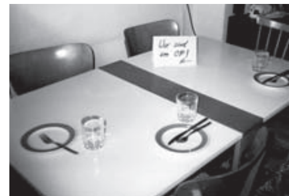
Arbeitsüberlastung anders dargestellt.

Rückwirkend gibt es zum 1. Januar wesentliche Tarifverbesserungen für die Klinikärzte.