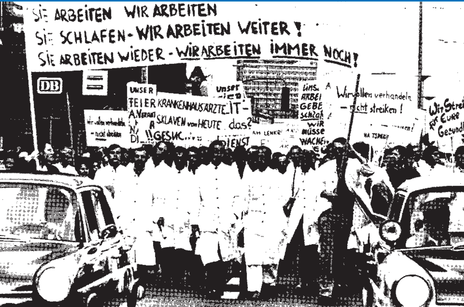
Hamburgs Klinikärzte demonstrieren gegen überlange Arbeitszeiten.