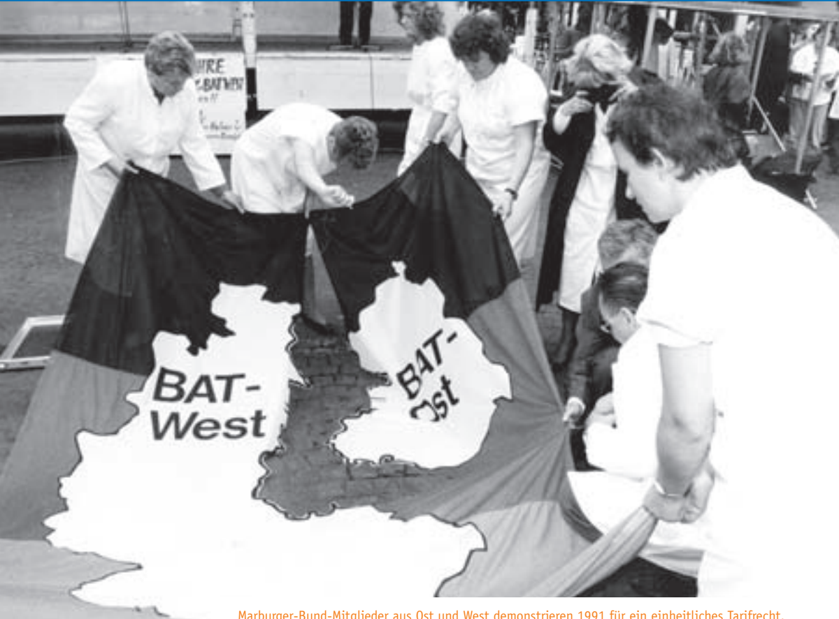
Marburger-Bund-Mitglieder aus Ost und West demonstrieren 1991 für ein einheitliches Tarifrecht.