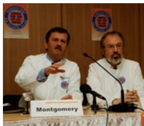
Die Marburger-Bund-Verbandsspitze um Frank Ulrich Montgomery und Rudolf Henke informiert die Presse über den „Computerstreik“.

Zudem unterstützt der Marburger Bund Gerichtsverfahren seiner Mitglieder auf Anerkennung der Bereitschaftsdienste als Arbeitszeit. — Sämtliche Klagen werden gewonnen.